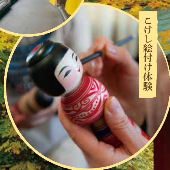
こけし絵付け体験