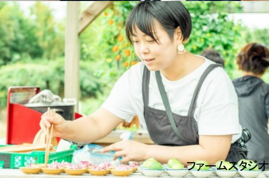
ファームスタジオ