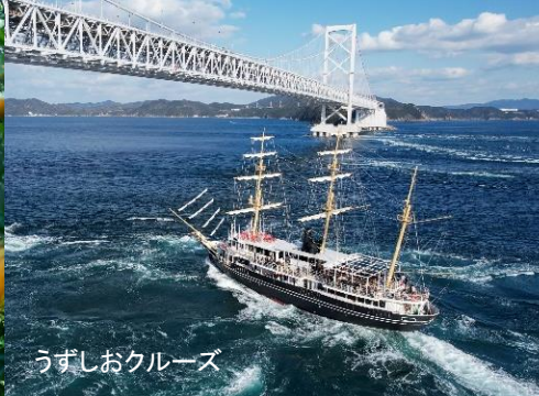
うずしおクルーズ