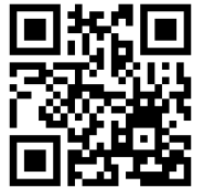
青森りんごの歴史動画