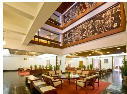
倉敷国際ホテルロビー 棟方志功の木板画