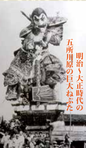
明治／大正時代の 五所川原の巨大ねぶた