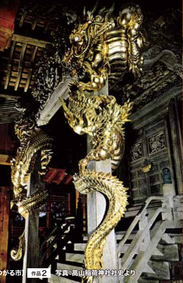
高山稲荷神社(つがる市) 作品2