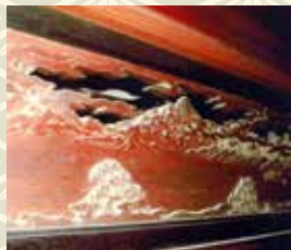
作品1 太宰治記念館「斜陽館」欄間

明治時代の巨大ねぶたを造った彫刻家 明治5年弘前生まれ、後に五所川原に定住。14歳で神仏彫刻家奈良嘉三郎の門に入り8年間修業後、23歳まで前田常吉について研究を重ね、抜群の才能を発揮。一般美術の彫刻にも精進し、昭和4年に国際美術展に初入選、以降入選を重ねる。明治末期～大正にかけて、有名な五所川原の巨大ねぶたを製作指導し、太宰治記念館「斜陽館」の一階仏間の出書院の欄間を制作。