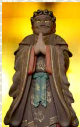
作品3 法永寺(五所川原市) 鬼子母尊神像