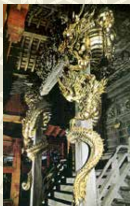
作品2 高山稲荷神社(つがる市) 本殿向拝柱巻龍