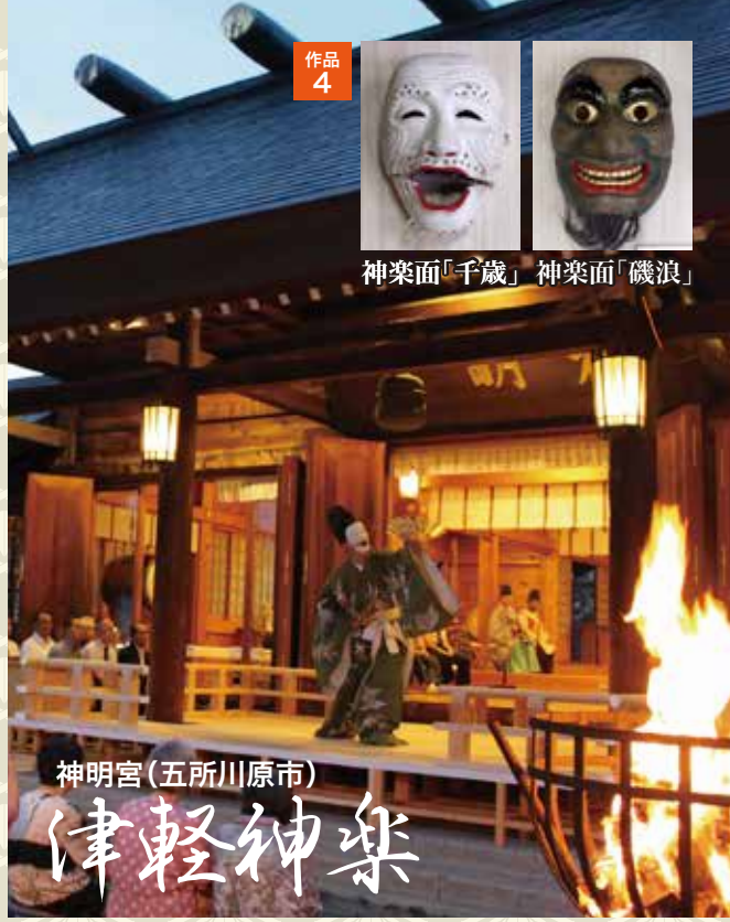
神明宮(五所川原市) 津軽神楽