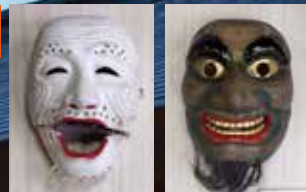
神楽面「千歳」 神楽面「磯浪」