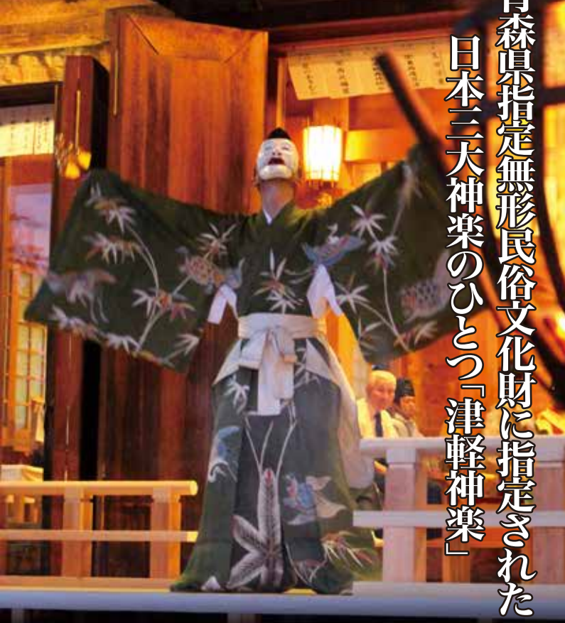
神明宮(五所川原市) 作品4